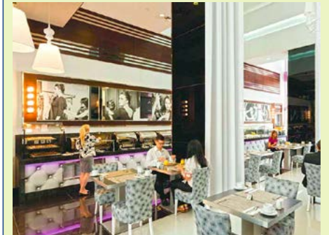
Frühstück in stilvollem Ambiente