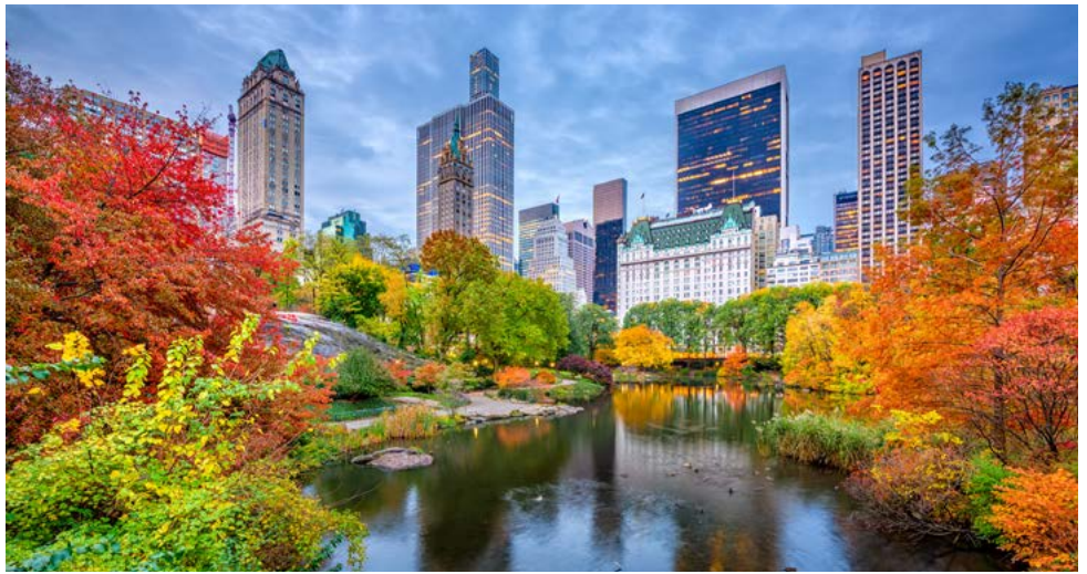
Central Park im Herbst